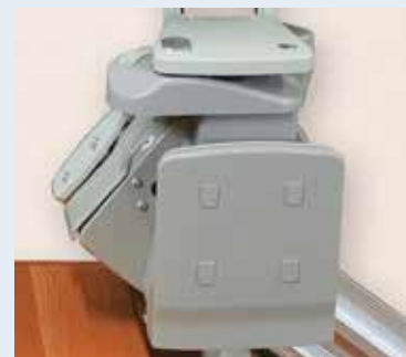
Descanso de pies que se dobla automáticamente hacia arriba/abajo cuando el asiento se levanta/baja. Control en descanso de brazos opcional.