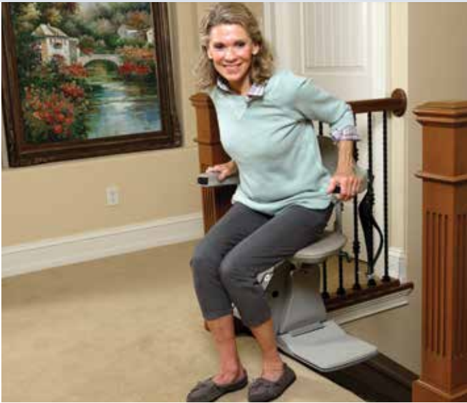
Movimiento giratorio con desnivel para subir/bajar fácilmente.