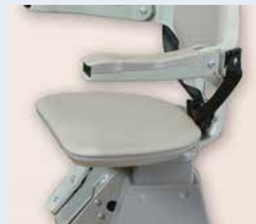
Asiento giratorio automático para subir/bajar sin esfuerzo. Controles en los brazos para subir y bajar la unidad.