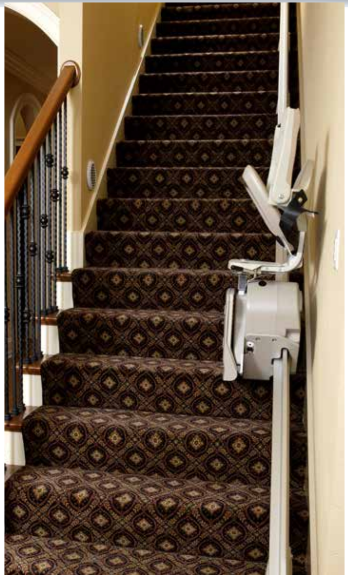
Diseño automático y desplegable para el mejor uso del espacio en los pasillos.

“El personal fue muy profesional y servicial. La silla es maravillosa recomendaré el producto y la compañía”.