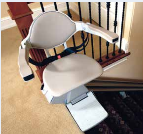
Asiento cómodamente acojinado.