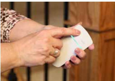
Dos controles remotos inalámbricos que permiten enviar/traer las sillas.