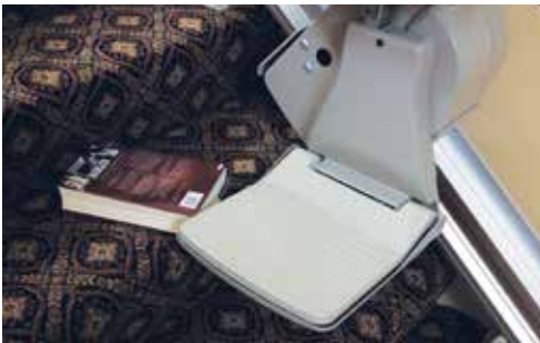
Détecteurs d'obstacles assurant la sécurité